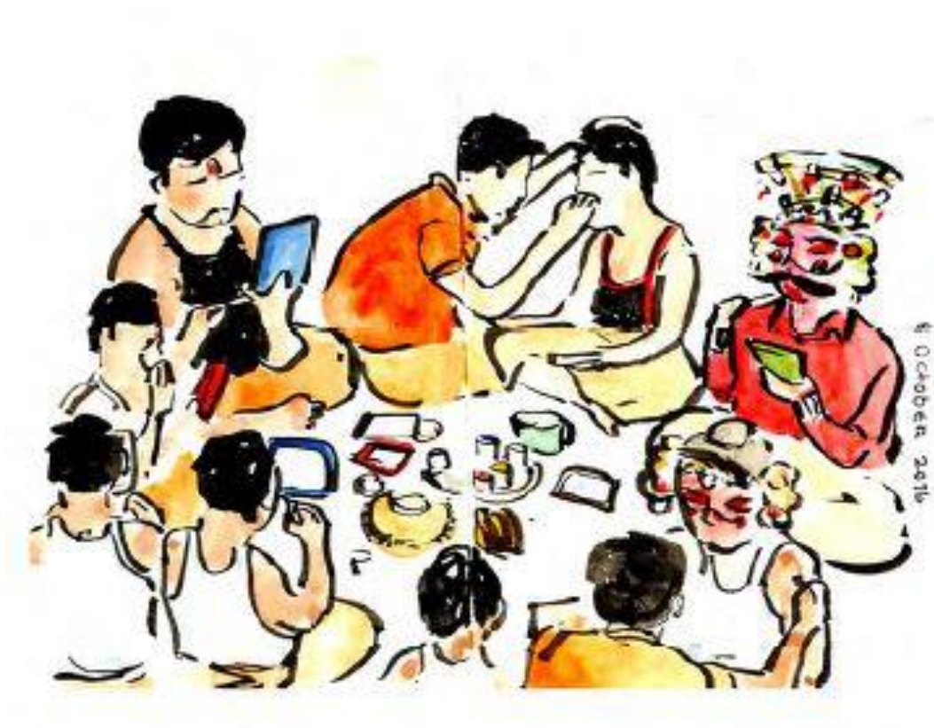
Tekening uit het schetsboek van Cal Brackin, volunteer