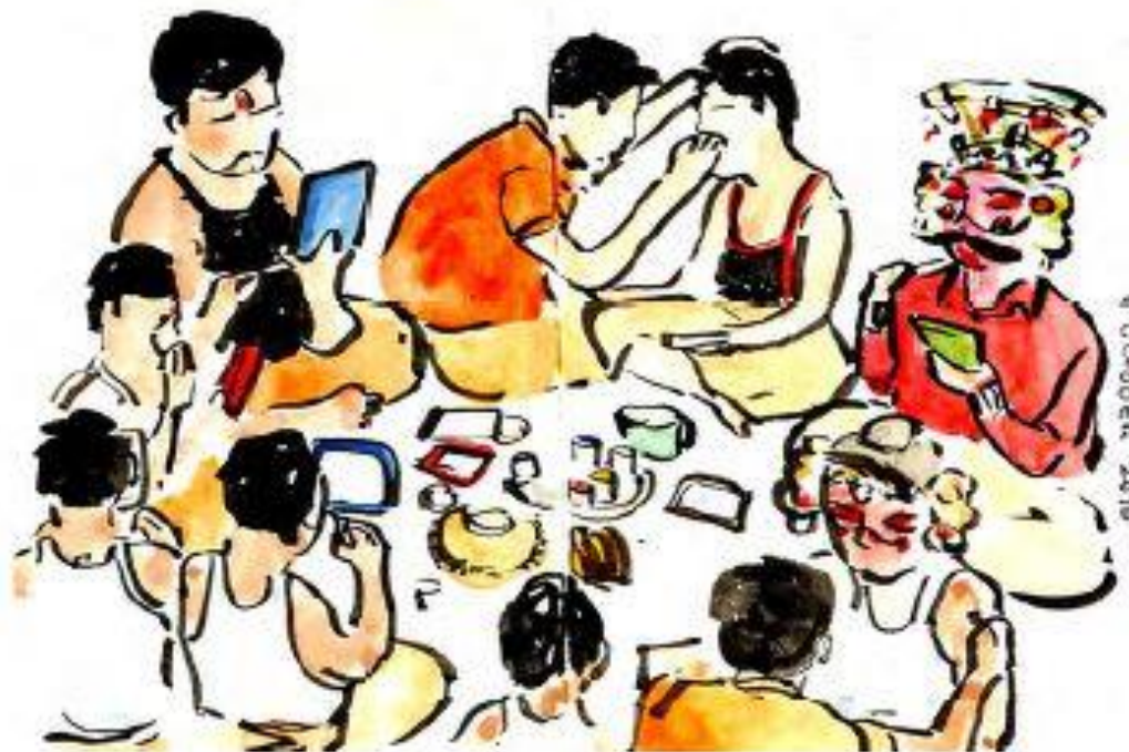
Tekening uit het schetsboek van Cal Brackin, volunteer